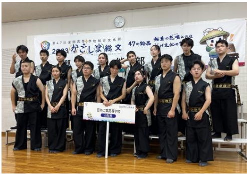
全国総文祭に出場した太鼓部員

部活動は、オリンピック金メダリストを輩出し、全国優勝者を出したレスリング部をはじめ、サッカー部、バレーボール部、野球部、ソフトテニス部、バスケットボール部、陸上部、卓球部、テニス部、ハンドボール部、弓道部、剣道部、山岳・スキー部、バドミントン部、茶道部、太鼓部、写真部、吹奏楽部、エコカー部、ロボット工学部、囲碁・将棋部、資格取得部、環境化学部、文化・生活部等多くの部が活躍しています。