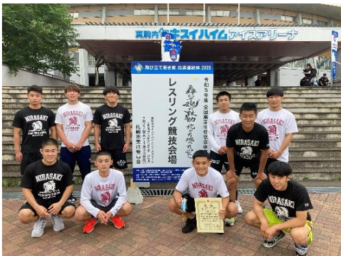
インターハイに出場したレスリング部員